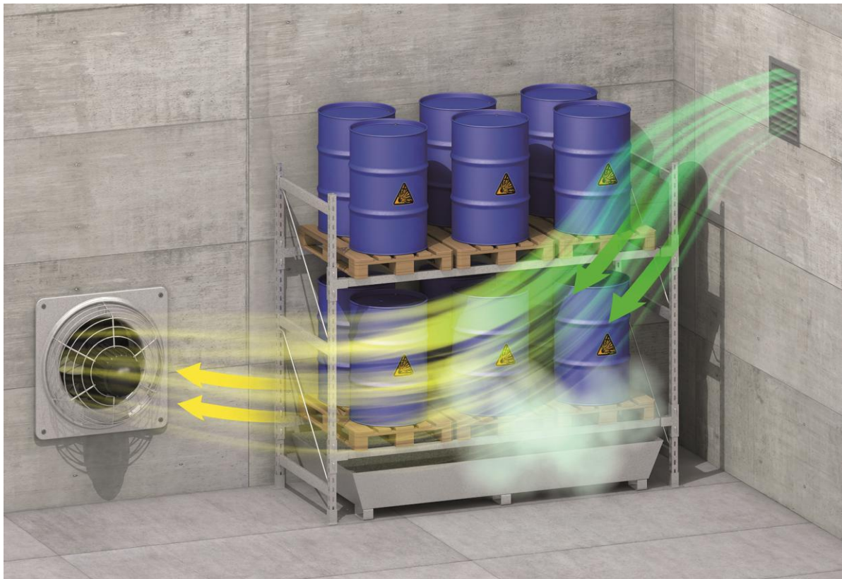
Beispielhafte Zu- und Abluft-Situation in einem Gefahrstofflager

In vielen Industrien und Anwendungen kann explosionsfähige Atmosphäre in Form von Gasen, Dämpfen oder Stäuben entstehen. Für den Explosionsschutz ist daher ein Entlüftungssystem notwendig, um diese explosionsfähige Atmosphäre aus dem Raum zu transportieren. Typische Bereiche, in denen explosionsfähige Atmosphären entstehen können, sind die chemische und petrochemische Industrie, Wasserstoffanwendungen, die Lebensmittelindustrie, Gefahrstofflagerung oder Biogasanlagen.